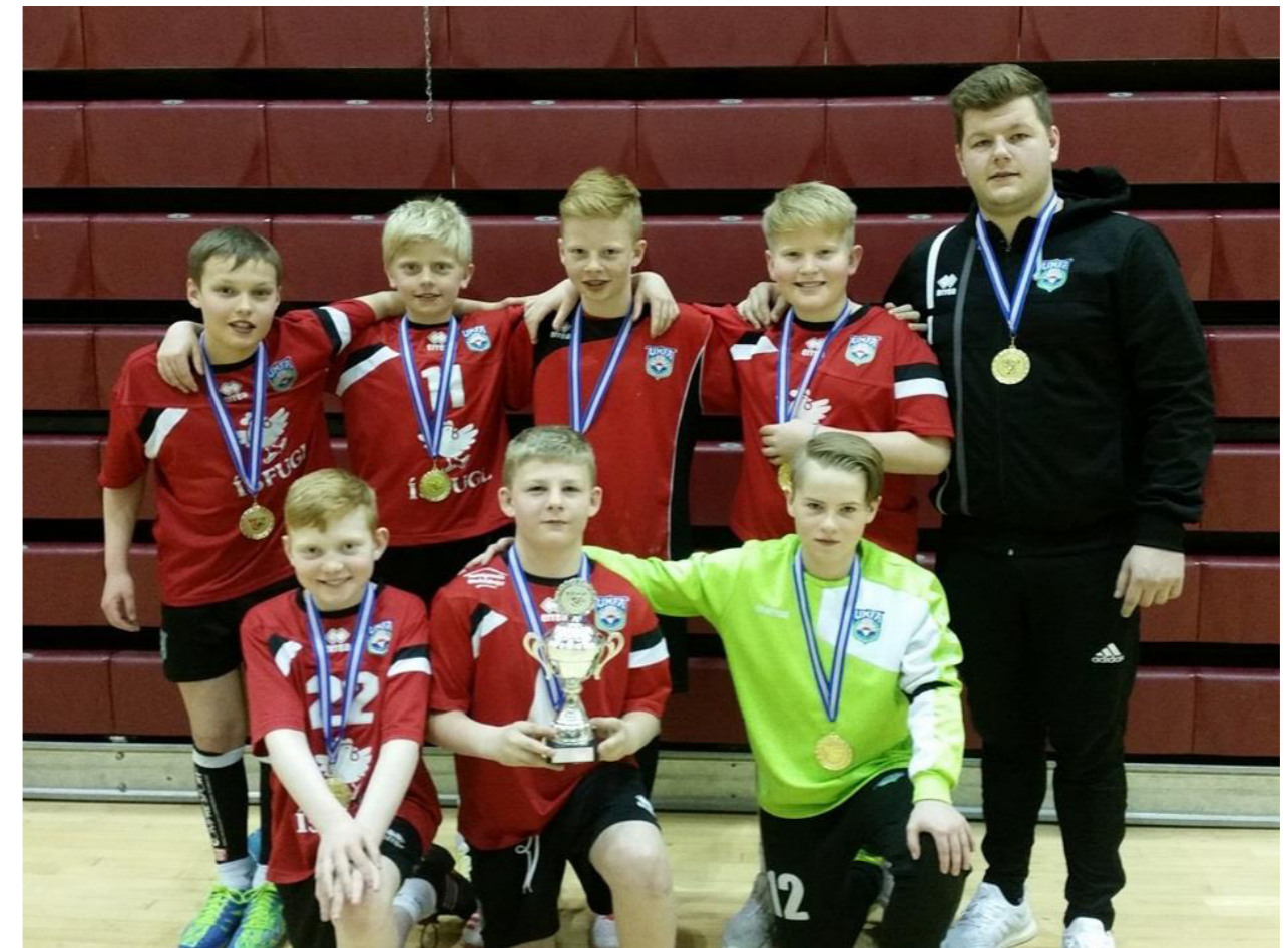
Íslandsmeistarar 2018 - í 6.fl. karla á eldra ári - Afturelding1