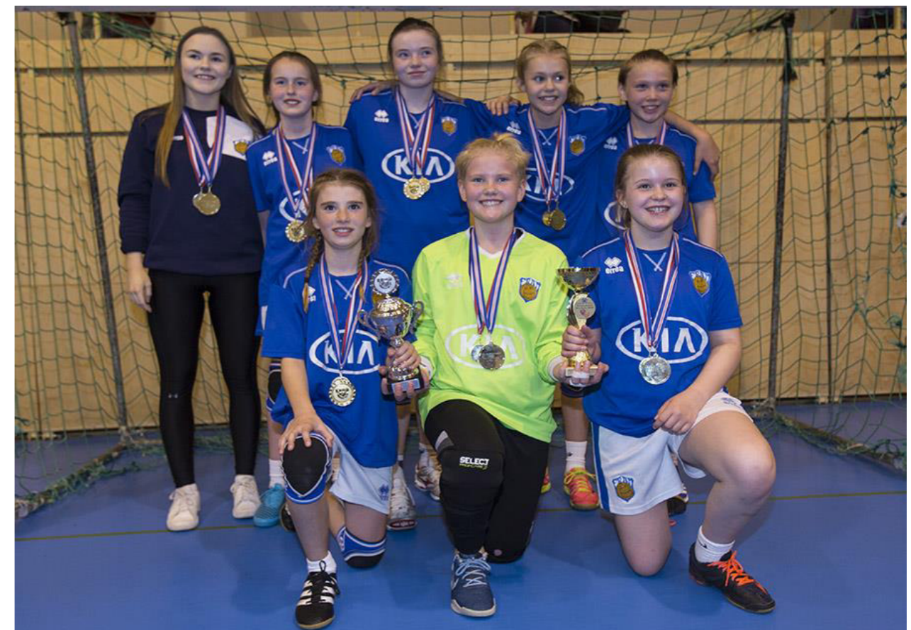
Íslandsmeistarar 2018 í 6. fl. kvenna á eldra ári - Fram-GH1